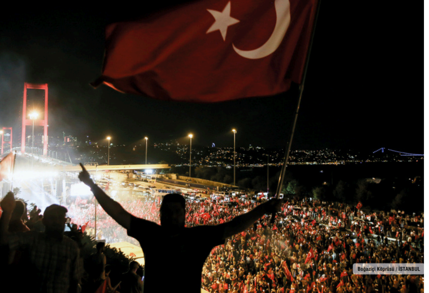
Boğaziçi Köprüsü / İSTANBUL

Cumhurbaşkanı Recep Tayyip Erdoğan'ın çağrısıyla sokağa dökülen Türk milletinin gösterdiği cesaret ve kararlılıkla elde edilen bu zafer, dünyada örneği olmayan bir ruh halini ve demokrasi bilincini ortaya koymaktadır. Zaferle sonuçlanan bu anlamlı direniş ve mücadele ruhunu toplumsal hafızada her daim diri tutmak amacıyla "15 Temmuz Demokrasi ve Milli Birlik Günü" her yıl özenle hazırlanan çeşitli etkinliklerle anılmaktadır.